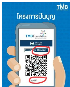
บริจาคได้ทุกธนาคาร